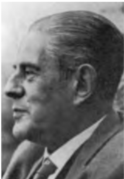
Pere Bosch Gimpera, primer rector de la Universitat Autònoma de Barcelona i conseller de Justícia de la Generalitat (1937-1939).

torietat de la col·legiació del professorat dels centres privats d'ensenyament.