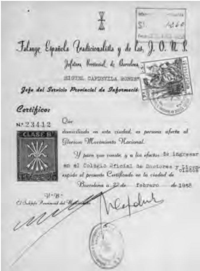
Document que havien de presentar els qui es volien inscriure al Col·legi.

interí de la secció de química analítica i director del Laboratori General d'Assaigs i Anàlisis de la Diputació de Barcelona, situat aleshores a l'Escola Industrial del carrer Urgell. L'any següent va consolidar a perpetuïtat el càrrec de cap de secció i continuà de director del Laboratori. Es jubilà voluntàriament el 1982 als seixanta-cinc anys.